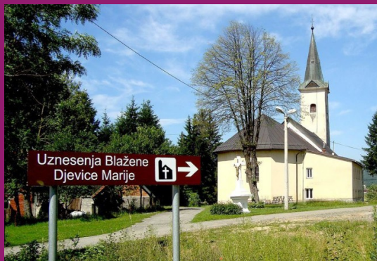
Župna crkva Uznesenja Marijina u Brinju